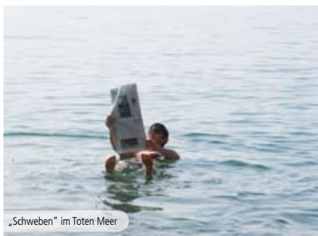
„Schweben“ im Toten Meer

1.Tag: Anreise. 2.Tag: Transfer nach Petra (ca. 3 Std.) und Besichtigung des UNESCO Weltkulturerbes . 3.Tag: Start unseres Rittes über Bergpfade und durch kleine Dörfer mit grandiosem Blick über Petra. 4.Tag: Ritt durch Täler, in denen viele Beduinen wohnen. 5.Tag: Im nördlichen Teil der Wadi Rum Wüste, ebenfalls UNESCO Weltkulturerbe , erwarten uns unvergessliche Galoppaden . 6.Tag: Durch atemberaubende Canyons geht es heute zur höchsten Sanddüne im Wadi Rum . Durch den legendären Lawrence von Arabien ist diese Gegend bekannt. 7.Tag: Spektakuläre Felsformationen säumen unseren Weg. 8.Tag: Ritt zum Beduinen-Camp. 9.Tag: Transfer (3 Std.) zum Toten Meer , hier haben wir Zeit zum Entspannen. 10.Tag: Abreise. 6 Reittage je 5-6 Std.