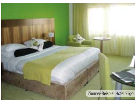
Zimmer-Beispiel Hotel Sligo