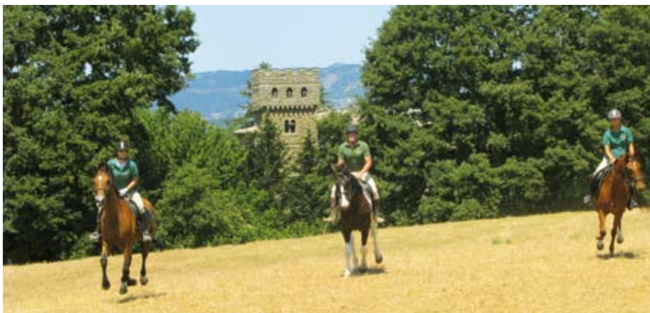
Vom Gelände der Burg reiten wir direkt in romantische toskanische Landschaft