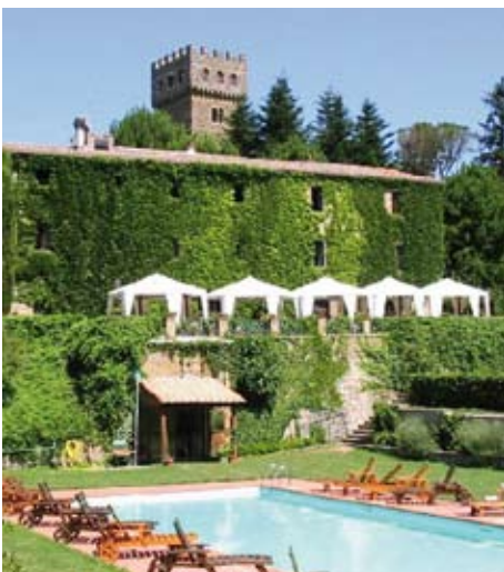
Swimmingpool und Liegewiese an der Burg zum Entspannen

Insgesamt 10 Reiteinheiten. Anfänger erhalten zunächst Longenunterricht bis die nötige Sicherheit für den Gruppenunterricht oder Ausritte erreicht ist.