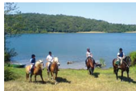
Rast am See

Gästemeinung: „Sensationelle Pferde! Reitführung kompetent, sehr erfahren und geduldig. Die Verpflegung ist ein Traum, das Essen wird mit Liebe zubereitet.“ D.Z. „Sehr gute Beratung, wir konnten unsere Traumhochzeit vorher optimal planen. Pferde sehr gepflegt, geländesicher ruhig, aber nicht langweilig. Ausritte abwechslungsreich. Die Guides äußerst kompetent und umsichtig, Dressurunterricht fantastisch. Hervorragende Unterkunft. Verpflegung: besser nicht möglich, alles frisch, lecker, mehr als ausreichend. Grandiose Landschaften.“ D.N.