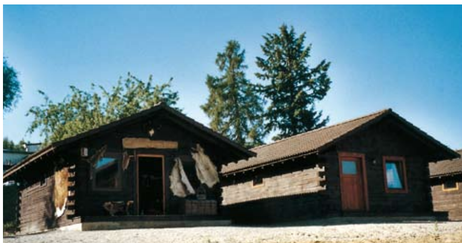
Übernachtung in Western-Art