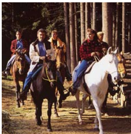
Ausritte - Rai-Reiten

Gästemeinung: „Pferde sehr gut, gepflegt, geschult, mit Charakter.“ J.R. „Pferde sehr gelassen und ausgeglichen, sensibel auf Hilfen reagierend, sehr brav im Umgang. Reitprogramm sehr gründlich, ausführlich und fundiert; abwechslungsreich, sehr informative Theorie. Entspannte Atmosphäre während des Unterrichts, präzise Erklärungen, sympathische und geduldige Reitlehrerinnen. Unterkunft sauber, schön gemachte Blockhütten, passend zur Western-City.“ M.B.