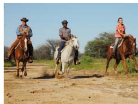
Auf sicheren Pferden in kleinen Gruppen durch den Busch

Packen wir's an! Entspannt Westernreiten lernen von entspannten Pferden in einem entspannten Land. Wo gibt es das? Viel Platz, wenig Menschen, viel Natur, kein Stress und Pferde, die natürlich aufwachsen und leben. Für diese Pferde ist der Mensch Partner und Freund. Sie tragen auch den blutigen Anfänger sicher durch den afrikanischen Busch. Wir beginnen mit Übungen auf dem Platz, machen Halb- und Ganztagesritte, wagen vielleicht am Ende der Woche einen Schnupper-Viehtrieb. 6 Reittage, insgesamt 24-30 Std.