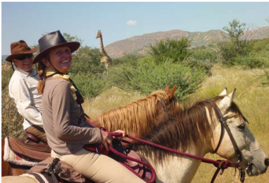
Strahlende Gesichter angesichts von Giraffen