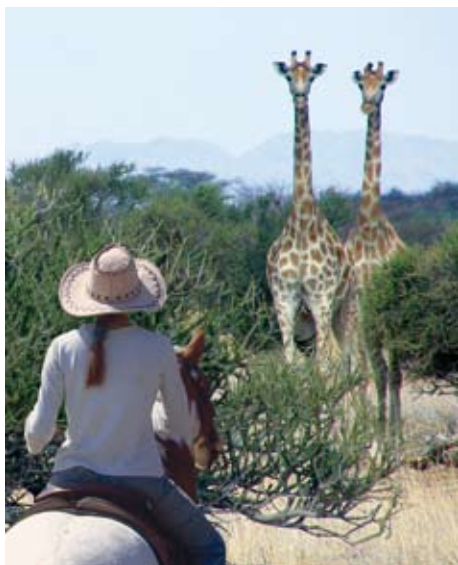
Mit etwas Glück begegnen uns Giraffen auf dem Trail

Pferde, Reitprogramm: Ca. 40 (davon ca. 20 für die Gäste) gut gerittene und ausdauernde Westernpferde aus eigener Zucht (ca. 145-155 cm). Western- und McClellensättel, Wassertränke. Deutsche Reitführung.