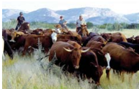
Rinder treiben zu Pferde in Namibia

Gästemeinung: Erongo-Trail: „Ausgeglichene, ruhige, gelassen, gesunde, kräftige, ausdauernde Pferde. Es war eine Freude auf ihnen zu sitzen. Sehr liebe und geduldige Reitführung. Auch mal zu einem kleinen Spaß aufgelegt. Unterkunft sauber, ordentlich, gemütlich, wunderbar. Verpflegung sehr, sehr lecker. Immer sehr viel und für jeden etwas dabei. Landschaft und Natur wunderschön, einladend und herrlich.“ P.R. „Pferde extrem ausdauernd, zäh, sehr unkompliziert zu reiten nach kurzer Umstellung auf den Western-Stil. Wunderschöne endlos lange Galoppaden durch die ausgetrockneten Flussbetten. Reitführung sehr umsichtig und zuverlässig, Umgang mit den Pferden ausgezeichnet. Wunderbare Unterkunft. Das Erongo-Gebirge atemberaubend schön mit ungewöhnlichen Felsformationen.“ V.G. Sternritte: „Super geplante, abwechslungsreiche Touren mit tollen Galoppaden und jeder Menge Wildbeobachtungen. Sehr aufmerksame Reitführung, immer um das Wohl aller bemüht. Scheinbar endlose, weite Reviere und versteckte Pfade durch hüfthohe Gräser, dazu unvergess-