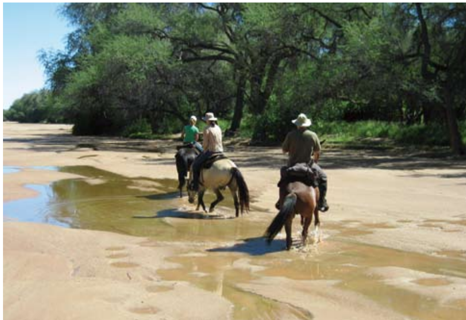
Sandige Flussbetten sind ideale Reitwege

liche Sonnenauf- und -untergänge – einfach nur wunderschön. Gastgeber, die so herzlich und fürsorglich sind, dass man das Gefühl hat, Zuhause zu sein.“ D.B. „Leichttrittige, trittsichere Pferde, die mit den kleinsten Hilfen super zu händeln