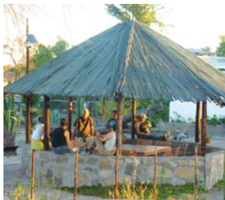
Plauderstunde nach dem Ritt und vor dem Abendessen