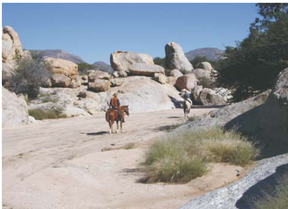
Vorbereit an bizarren Felsformationen - Namibia bietet eine Vielfalt an Landschaften

waren. Etwas besonderes ist es, wenn man mit den Kudus um die Wette reitet, bei der Rinderarbeit hilft und beim Rindertreiben teilnimmt. Für uns war das Essen wie für 5 Sterne. Super Küche.“ K.M.