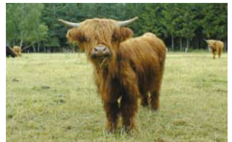
Es begrüßt uns Hugo aus dem hoteleigenen Wildpark

An insgesamt 6 Reittagen unternehmen wir mehrstündige Ritte zu beliebten Natur- und Kulturdenkmälern . 1.Tag: Ritt durch den hoteleigenen 300 ha großen Wildpark – vorbei an Wisenten, Hirschen und Straußen. 2.-3.Tag: Wir reiten auf den Spuren des Wilddiebs Gangloff zum Gangloffkreuz und durch die Wälder des Barons von Knigge. 4.Tag: Es geht zum Rügegericht „Wüste Kirche“, einer geschichtsträchtigen Gerichts-