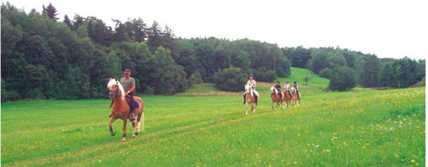
Der Harz: ideal für Ausritte in unberührter Natur