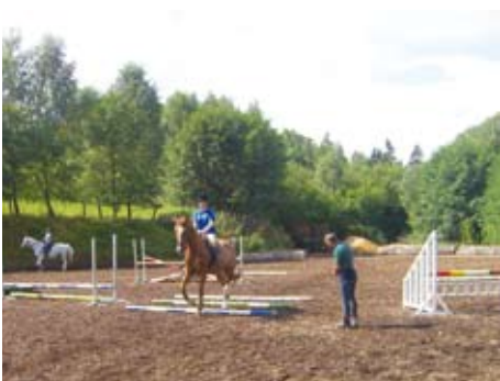
Fördernder Unterricht im Harz

An 6 Reittagen 10 Reiteinheiten, zunächst Longen- und dann Gruppenunterricht bzw. je nach Wunsch und Reitqualifikation Ausritte.