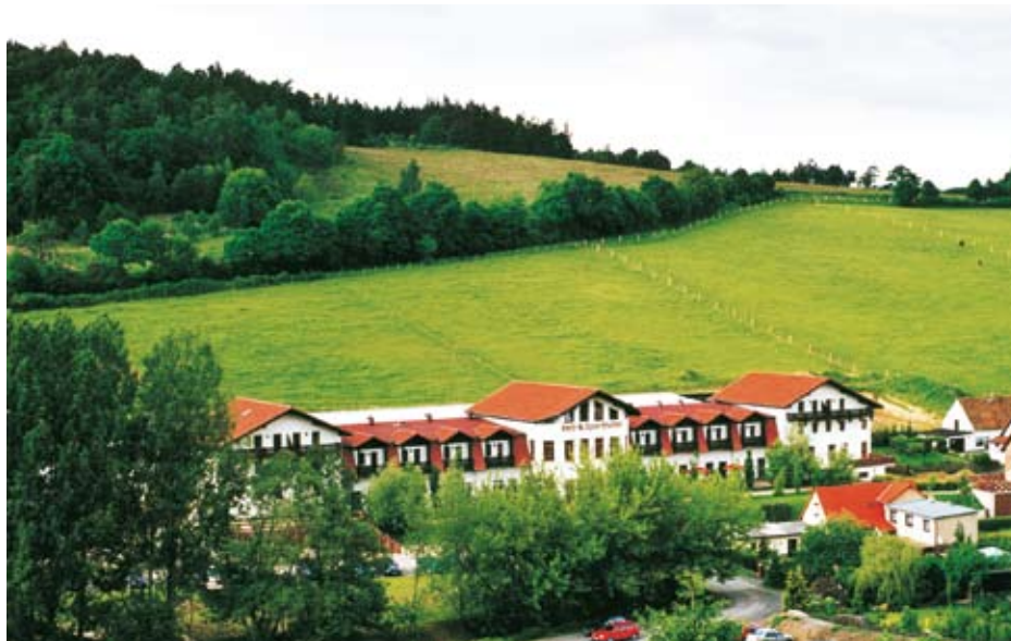
Das Reiterhotel Harz - idyllisch gelegen mit direktem Anschluss zur Natur