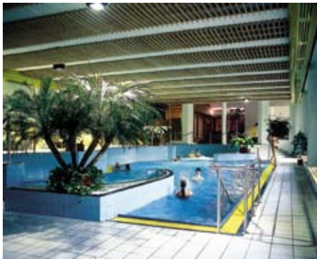
Schwimmbad mit Sauna, Solarium und Beauty-Anwendungen

wurde mit viel Spaß und Motivation durchgeführt. Lernerfolg erkennbar. Sehr schönes Hotel. Saubere, gepflegte Zimmer und Pool- und Saunalandschaft. Super nettes und freundliches Personal.“ S.E. „Sehr gute ausgebildete Schulpferde, freundlich und gutmütig. Sehr freundliche und kompetente Reitlehrer, individuelle Förderung. Geräumige gemütliche Zimmer. Reichhaltige Halbpension. Ausgesprochen sympathische Mitreiter.“ A.N.