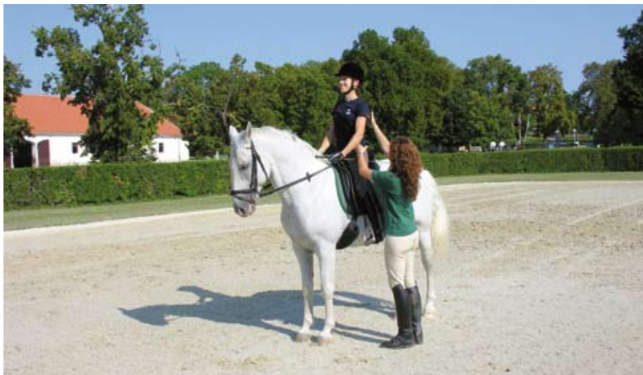
Dressur-Unterricht in Lipica auf reinrassigen Lipizzanern mit intensiver Sitzkorrektur durch deutschsprachige Reitlehrer/innen