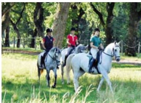
Ausritte durch den Karst sind vor Ort buchbar

Pferde, Reitprogramm: Lipizzaner (ca. 155-158 cm). 4 Reithallen, mehrere Dressurvierecke, Vorführungen Klassischer Dressur (Apr.-Okt.). Deutschsprachige Reitlehrer. Reiteinheiten je 50 Min. Zusätzl. Ausritte für erfahrene Reiter vor Ort buchbar.