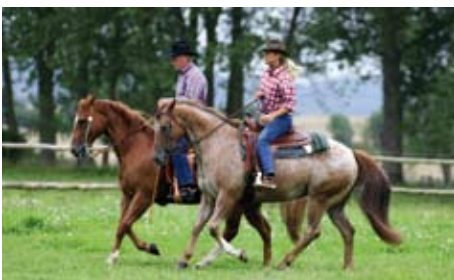
Westernreiten auf gut gerittenen Quarter Horses