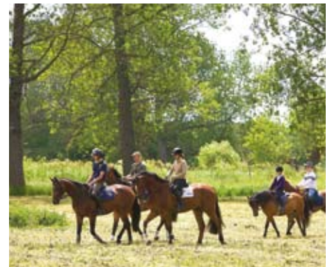
Ausritt mit der ganzen Familie

Insgesamt 10 Reiteinheiten für 2 Erwachsene und 1 Kind bis zu 10 Jahren (gegen Zuzahlung für weitere Kinder buchbar). Je nach Reitqualifikation sind auch gemeinsame Ausritte möglich. Tägliche kostenlose Betreuung Ihres Kindes in der Kindervilla. In der Zwischen- und Hochsaison ist entweder ein 2-stündiger Segeltörn oder ein Verwöhn-Familienpicknick am Strand im Preis enthalten.