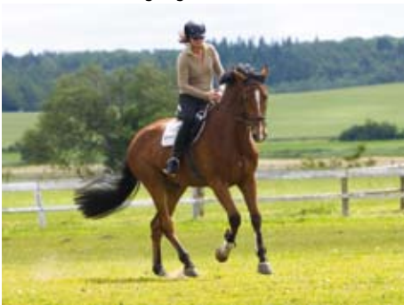
Ausritte im Standard- („englischen“) Stil

In traumhafter Lage, direkt am Ostseestrand und umgeben von dichten Buchenwäldern erstrahlt die Weiße Stadt am Meer. Nur ca. zwei Fahrstunden von Berlin und Hamburg entfernt, können Sie hier mit allen Sinnen genießen: in traumhaften Zimmern und Suiten, im 3000qm großen SPA, bei meisterhafter Kochkunst, in zauberhafter Naturlandschaft bei einem Ausflug zu Pferd oder bei intensivem Reitunterricht, einer Partie Golf oder einem atemberaubenden Segeltörn in den Sonnenuntergang.