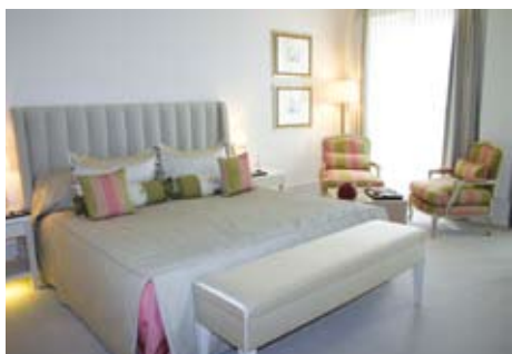
Zimmer im Grandhotel in Heiligendamm (Beispiel)

Anreise: Pkw. Bahn bis Bad Doberan. Flug bis Rostock-Laage (20 km), Bustransfer in Kooperation mit Germanwings, Flug bis Berlin (235 km) oder Hamburg (181 km), Mietwagen. Privat-/Bedarfsflughafen: Rerik-Zweedorf (20 km). Anreise mit eigenem Pkw oder Mietwagen empfohlen.