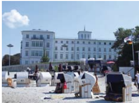
Strandleben mit Strandbar direkt vor dem Hotel

Pferde, Reitprogramm: Großes Gestüt (gehört zum Grand Hotel, ca. 3 km entfernt), Mecklenburger und Holsteiner (teilweise bis Kl. L ausgebildet), Quarter Horses. Reithalle (20x60 m), Dressurviereck (20x60 m). Longen- und Gruppenunterricht je 45 Min., Ausritte je 60 Min., bei Eignung auch Springunterricht. Strandritte nur von Oktober bis März möglich. Weitere Reiteinheiten sind je nach Verfügbarkeit vor Ort buchbar. In der Western-Reitweise sind für Fortgeschrittene nur Ausritte möglich.