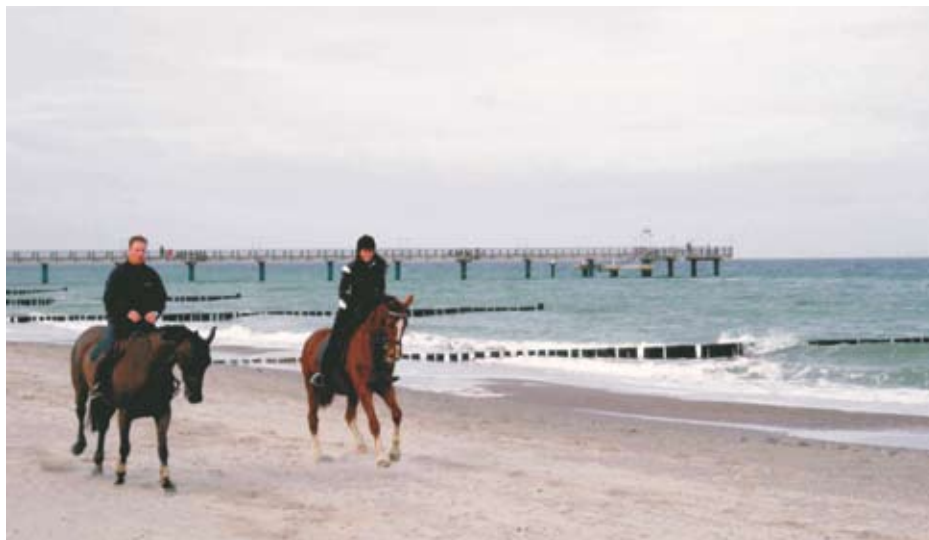
Galopp am Ostsee-Strand außerhalb der Badesaison

und wunderschöne Anlage ideal auch für mitreisende Nichtreiter.“ I.K. „Tolle Beratung durch PFERD & REITER. Strandritt unvergleichbar schön. Reitlehrer sehr sympathisch, guter Unterricht. Sehr luxuriöse Unterkunft. Hervorragende Küche. Ganz tolle Atmosphäre am Meer.“ S.E. „Longenunterricht zeitlich auf uns abgestimmt, immer vorbereitet und pünktlich. Pferd auf uns abgestimmt, super. Sehr guter Reitlehrer. Einmalige Unterkunft. Sehr gute Verpflegung. Highlight für mich: fast tägliches Sun-Rise-Yoga vom Hotel aus angeboten.“ S.G.