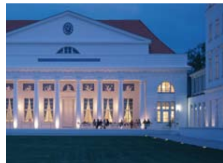
Abendessen auf der Terrasse des Kurhaus-Restaurants mit Ostsee-Blick

Gästemeinung: „Pferde ausgeglichen, gut ausgebildet, gepflegt, gut gehalten. Programm sehr flexibel, sehr auf Können und Wünsche eingegangen, Kunde ist König. Professionelle, sehr nette Reitlehrer, engagiert, sehr bemüht, perfekt! Sehr komfortable, wunderschöne Anlage und Zimmer, toller Blick (Seeseite). Super Frühstück, leckeres Essen. Landschaft: Heile Welt, wunderschöne Felder, Wiesen, Wälder, Strand.“ J.W. „Durch Strand, exzellente Wellness-Oase