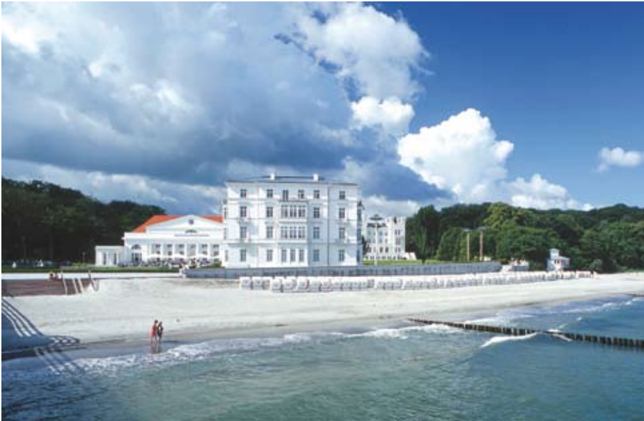
Grandhotel Heiligendamm - die „Weiße Stadt am Meer“