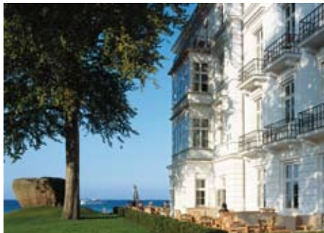
Herrlich entspannen auf der Terrasse mit Ostsee-Blick

Kinderbetreuung: Eisbären-Kinderclub in eigener Villa. In drei Gruppen werden die Mini-Eisbären (3-5 Jahre), die Maxi-Eisbären (6-12 Jahre) und die Teenie-Eisbären (ab 13 Jahren) ganztägig kostenlos betreut. Für die Kleineren Babysitter (ca. 15,- pro Std., vor Ort buchbar).