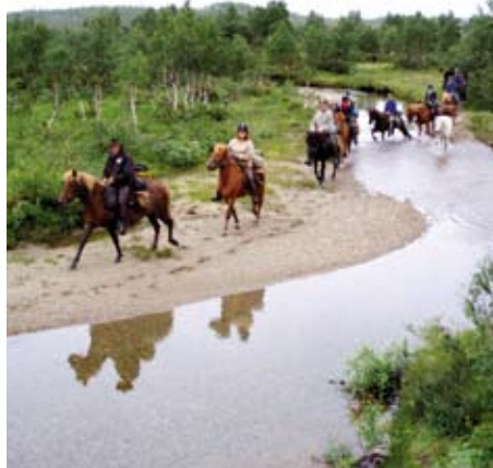
Problemlos durchqueren unsere Isis einen Bach

vollen. 4.Tag: Langer Reittag durch die Berge mit herrlichen Ausblicken. Übernachtung in Bjørnegen. 5.Tag: Wir reiten über einsame Waldpfade und wunderschöne Hochebenen und picknicken in einem friedlichen Tal, bevor wir unsere Herberge an einem See erreichen. 6.Tag: Über Hügel und Wälder erreichen wir die Bergregion Fonge. Picknick am Fluss. Wir durchreiten ein Rentiergebiet , mit etwas Glück entdecken wir einige der Tiere. 7.Tag: Rückritt zum Trailausgangspunkt, Abschiedsessen. 8.Tag: Abreise. 6 Reittage je 5-6 Std. (+ ggf. Proberitt), Gesamtreitstrecke ca. 165 km.