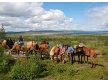
Norwegen - Kurze Rast im abwechslungsreichen Hochland

1.Tag: Anreise, Kennenlernen der Mitreiter, Tourenbesprechung und je nach Ankunftszeit Proberitt. 2.Tag: Ritt in die Berge. Inmitten unberührter Natur Picknick an einem Fluss , anschließend geht es weiter nach Nedalel, hier erwartet uns ein traditionelles Abendessen. 3.Tag: Traumhafte Ausblicke auf die Sylan-Bergkette . Einsame Pfade führen uns durch ruhige Täler bis zu unserer Übernachtungsstation in Storerik-