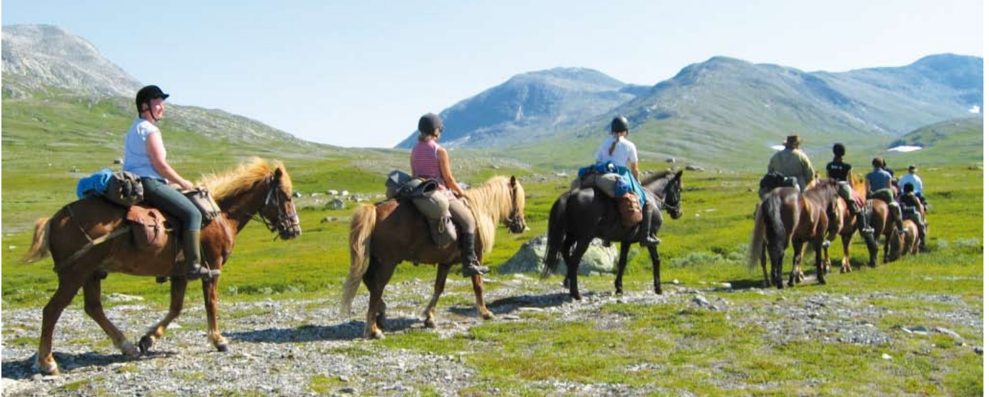
Einsame Bergwelt, saubere trockene Luft, warme lange Sommertage, sichere Island-Pferde = Norwegen-Trails