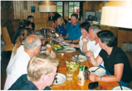
Abende in gemütlichen Hütten - ein Erlebnis

Norwegen. Traditionelles Abendessen. 6.Tag: Ritt durch dichte Birken- und Pinienwälder und Berglandschaften . 7.Tag: Rückritt zum Trailausgangspunkt, Abschiedsessen. 8.Tag: Abreise. 6 Reittage je 5-6 Std. (+ ggf. Proberitt), Gesamtreitstrecke ca. 170 km.