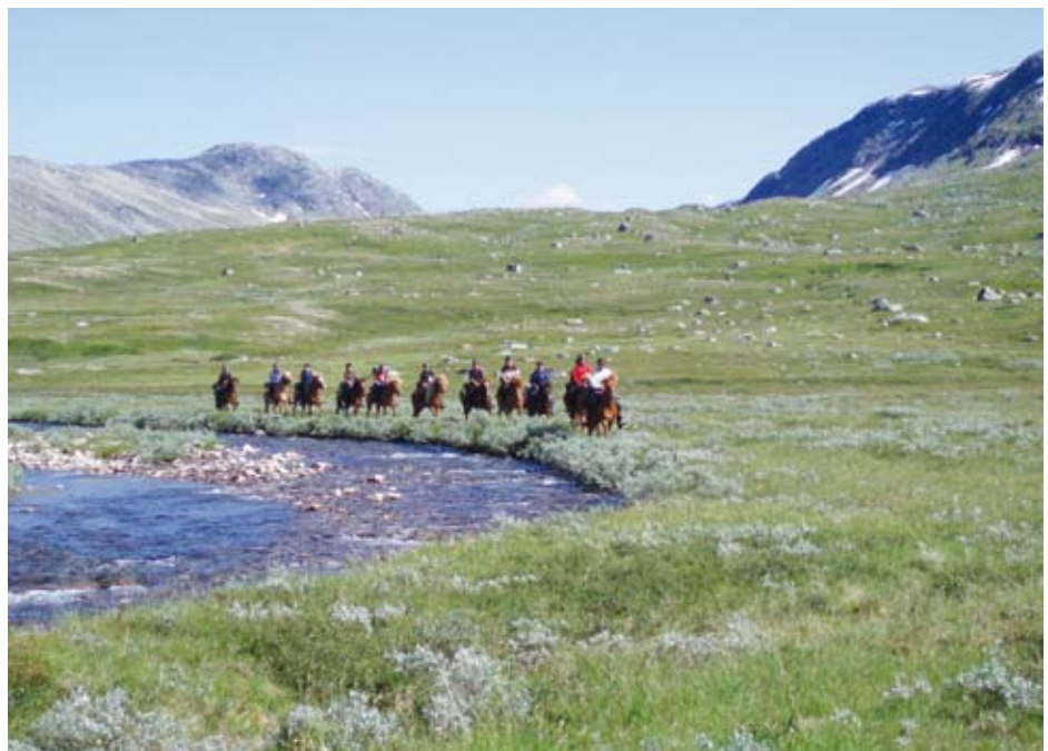
Isis, grüne Almen-Wiesen, Berge, Bäche und glückliche Reiter im Grenzgebiet Norwegen/Schweden

„Die Isländer sind sehr gut ausgebildet, rittig, trittsicher und brav. Programm perfekt auf die reiterlichen Voraussetzungen abgestimmt, sehr abwechslungsreich, hat viel Spaß gemacht. Reitführung sehr gut, gab Tipps, führte uns sicher und mit Spaß an der Sache durch die norwegischen Bergregionen. Unterkünfte rustikal und gemütlich. Verpflegung sehr gut, es wurde nicht am Essen gespart. Atemberaubende Landschaften. Die Mitreiter waren sehr nett und unkompliziert, die Gruppe passte perfekt zusammen.“ M.S.