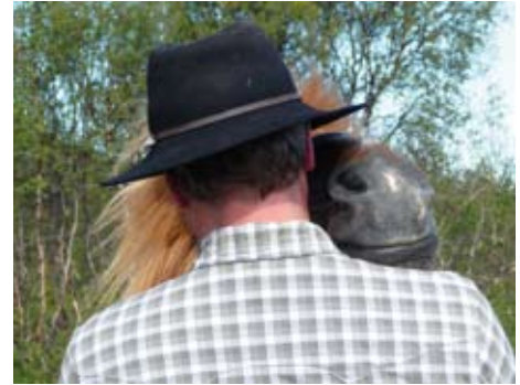
Neue Freunde im Norwegischen Hochland

Gästemeinung: „Pferde sehr trittsicher, geländegängig, ausdauernd, brav, enorme Kondition. Reitführer sehr erfahren, ortskundig, nett. Unterkunft gemütlich, komfortabel. Sehr gute, super leckere Verpflegung, auch für Vegetarier, mega vielseitiges Frühstücksbuffet. Herrlich, eine Woche unterwegs zu sein, ohne ein Dorf zu queren. Sehr nette und hilfsbereite Mitreiter.“ B.G.