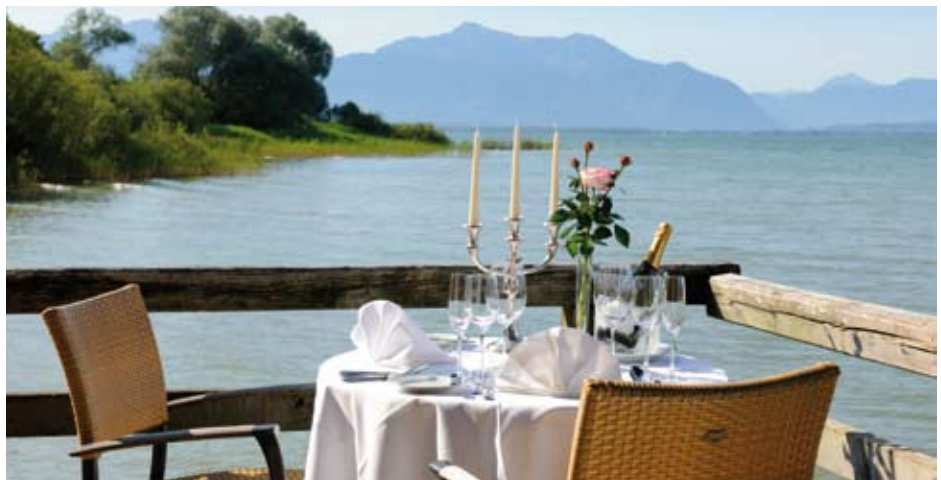
Auch ein romantisches Candle Light Dinner ist auf Anfrage und gegen Zuzahlung möglich

abends 3-Gänge-Menü, immer vom Feinsten. Direkt am Chiemsee gelegen mit Privatstrand.“ E.S. „Sehr gute Schulpferde, von denen man viel lernen kann, sehr gut erzogen, gepflegt und freundlich. Meine Wünsche wurden alle erfüllt: Ich wollte ein gemischtes Programm von Dressur, Einzel, Gruppe und Ausritt. Sehr nette erfahrene und gute Reitlehrer, die eine wunderbare Art haben, einem das Reiten näher zu bringen. Viel Spaß, viel gelernt. Hotelpersonal immer freundlich und zuvorkommend. Essen perfekt.“ M.F. „Durchlässige Pferde, alle sehr gut erzogen. Einfühlsamer Reitlehrer, sehr gute Erklärung. Schnuckelige Zimmer, sauber, tolle Badelandschaft. Verpflegung sehr lecker, reichlich, gute Zusammenstellung. Sehr ruhig gelegen, schöner Blick auf Chiemsee und die Alpen.“ M.F. „Tolles Hotel, auch mein Hund hat sich sehr wohl gefühlt.“ T.B.