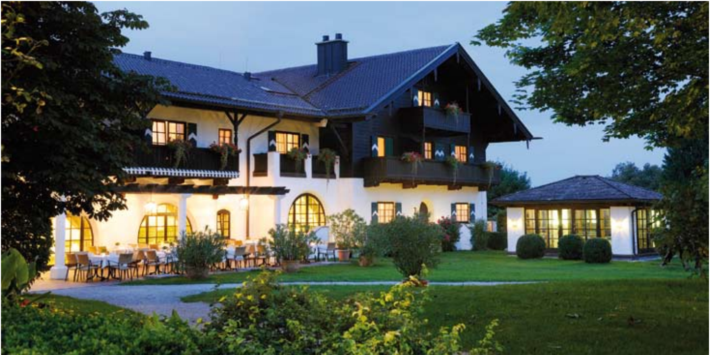
Idyllisches Reit- und Golfhotel am Chiemsee