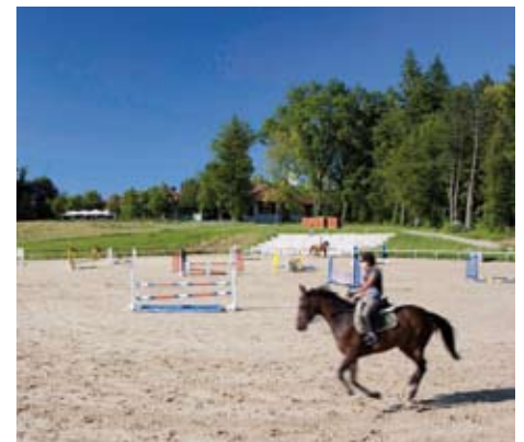
Außen-Reitplatz im Grünen

4x intensiver Einzelunterricht und 4x Gruppenunterricht bzw. Ausritte.