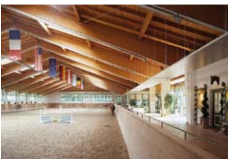
Große helle Reithalle mit Blick ins Grüne

Pferde, Reitprogramm: Eine Bilderbuch-Reitanlage. Warmblüter (teilweise Dressur bis Kl. M und Springen bis Kl. L ausgebildet) und Ponys. Insgesamt 3 Reithallen (68x28 m mit Restaurant und Panoramablick über den Chiemsee und die Alpenkette, 40x20 m und 32x16 m), 3 Sandplätze, Galoppbahn, Cross-Country-Strecke sowie