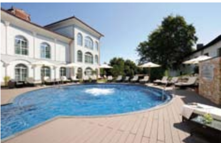
Außenpool und Liegebetten zum Entspannen

Anreise: Pkw. Bahn bis Traunstein (15 km), Taxitransfer (ca. 25,- pro Strecke). Flug bis München (150 km) oder Salzburg (50 km), Mietwagen.