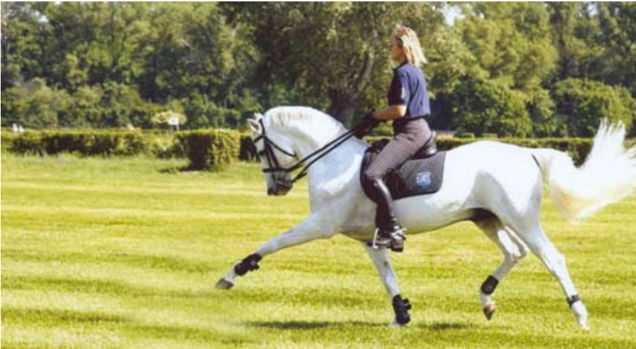
Die Schulpferde sind teilweise in Dressur bis Kl. M und im Springen bis Kl. L ausgebildet