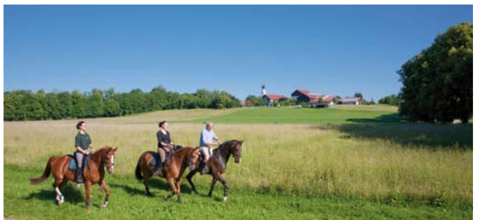
Ausritt durch abwechslungsreiche Landschaften am Chiemsee