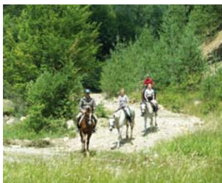
Grüne, fast unberührte Natur im Balkan-Gebirge

Boikovetz. Übernachtung in einem komfortablen Hotel. 6.Tag: Ritt mit Besuch des Klosters Etropole . Das Kloster wurde im 11. Jh. gebaut, 1858 restauriert und ist eines der wertvollsten bulgarischen Architekturdenkmäler. Übernachtung in diesem geschichtsträchtigen Gemäuer. 7.Tag: Panoramaritt nahe des Klosters und Ritt zurück zum Reitstall. Transfer zur Jagdresidenz und Abschiedsessen. 8.Tag: Frühstück, Abreise. 6 Reittage je ca. 5 Std. und zusätzlich Proberitt am Anreisetag.