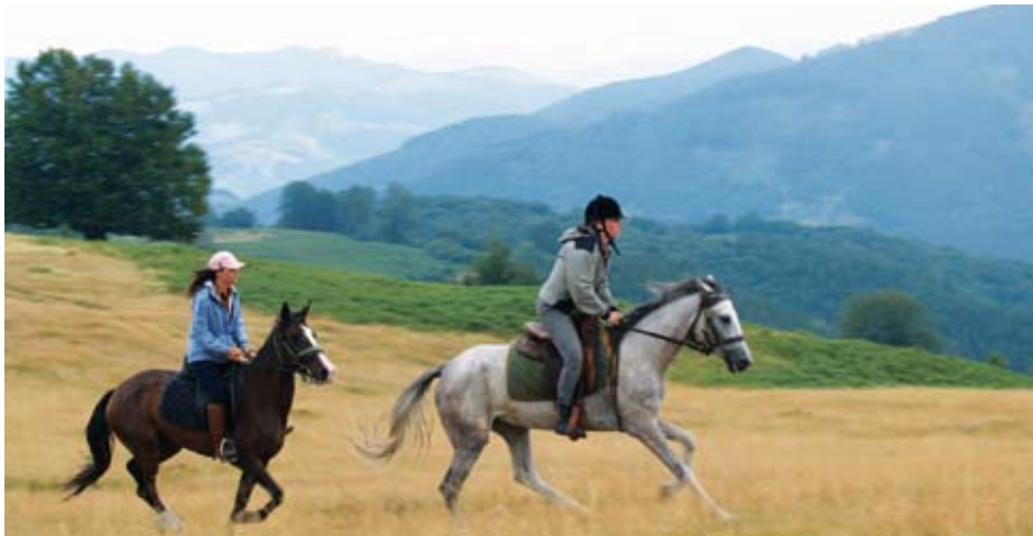
Im Galopp über die Hochweiden des Balkan-Gebirges