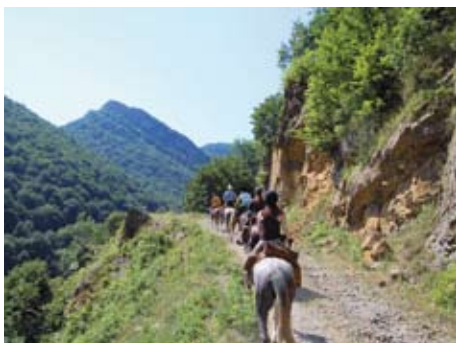
Unberührte Landschaften des Balkan-Gebirges

1.Tag: Anreise, kurzer Proberitt (ca. 30 Min.). 2.Tag: Vormittags Ritt in ein wildreiches Waldgebiet . Weiter geht es durch zwei für die Gegend typische Dörfer – Ribartza und Yamna. 3.Tag: Ruhiger Ritt durch wilde, ursprüngliche Natur mit Bergen , viel Rot- und Damwild, bis zu der höchsten Ebene der Gegend. 4.Tag: Wir reiten am Fuße des 1700 m hohen Berges Malka Baba. Unberührte Natur wohin man sieht. 5.Tag: Ein entspannter und erlebnisreicher Reittag liegt vor uns: vorbei an einer alten Römersiedlung und durch die Berge bis zum Ort