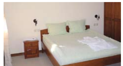
Zimmer der Jagdresidenz (Beispiel)

Gästemeinung: „1a-Pferde, super trittsicher und trotz Temperaments super händelbar, hervorragende Kondition, super Gesundheitszustand (Hufe etc.). Angenehmes Reitprogramm, kürzere und längere Touren abwechselnd, schöne lange Mittagspausen. Reitführer echte Horsemen, auch zu Reitern ganz toll, super aufgehoben gefühlt. Unterkunft einfach, aber sauber, das Kloster absoluter Wahnsinn. Verpflegung sehr lecker und reichlich, vor allem die Salate und der Schafskäse. Atemberaubende Landschaften. Super liebe Mitreiter.“ C.K.